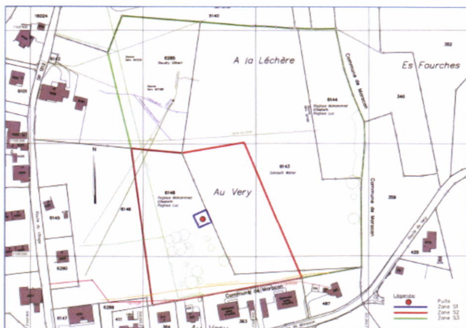
Enquête zones de protection

Une deuxième enquête a été publiée du 22 septembre 2017 au 23 octobre 2017 pour la légalisation des zones de protection et cette dernière a fait l'objet d'une opposition regroupant quatre propriétaires.