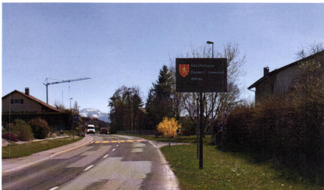
Exemple d'implantation de panneau d'information

Ce genre d'installation se rencontre de plus en plus dans les localités et a pour avantage de communiquer aux citoyens et visiteurs les informations officielles que la Municipalité souhaiterait faire passer. De plus, selon le souhait de quelques sociétés locales, des renseignements sur les manifestations locales pourraient être diffusés.