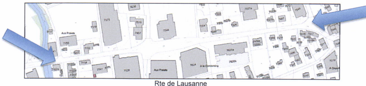
Rte de Lausanne

Dans le prolongement des travaux de réfection de la Route de Lausanne (RC 701) à la hauteur du centre commercial Aldi (préavis 03/2016 et 17/2017), la Municipalité souhaite mettre en œuvre l'étude de réfection du solde de la Route de Lausanne entre le carrefour du Landi et le giratoire de la Migros à Oron-la-Ville.