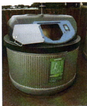
Container « Molok » avec système de pesage

De même, chaque titulaire d'une carte pourra visualiser le détail de ses apports et le solde de son compte.